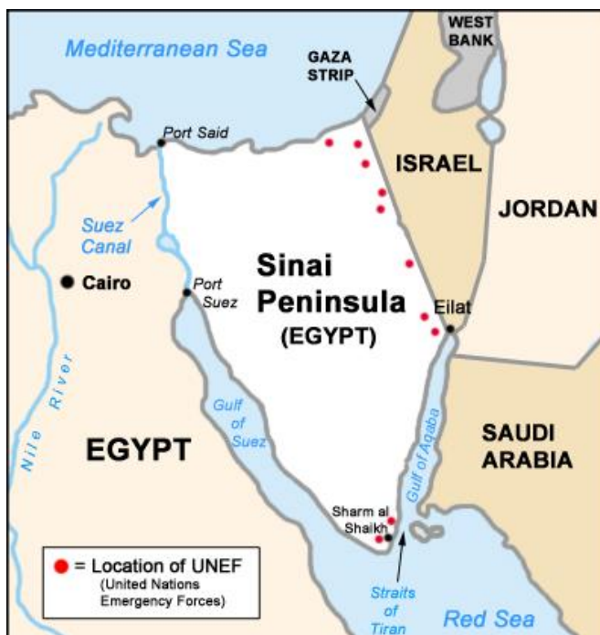
Figur 2: UNEF (FNs fredsbevarende styrker) utplasseringer på Sinaihalvøya i forkant av Seksdagerskrigen 5

Seksdagerskrigen kom i gang ved at Israel ble angrepet stadig mer intensivt og samtidig at de israelske motangrepene økte i frekvens i månedene før krigsutbruddet. 13. mai gav sovjeterne falsk etterretning til Egypt om at Israel planla et angrep på Syria. Allerede i november året før hadde Egypt og Syria inngått en forsvarspakt. Dagen etter rykket egyptiske tropper inn i Sinai, hvor FNs fredsbevarende styrke UNEF hadde vært stasjonert siden Suezkrisen i 1956. Egypt nektet å godta at UNEF var plassert på halvøya, og krevde at styrkene ble trukket tilbake. FNs generalsekretær U Thant innfridde kravene uten å konsultere med generalforsamlingen først som han var pålagt å gjøre. 3 23. mai 1967 lot Egypts president Gamal Abder Nasser sine tropper blokkere Tiranstredet, som er innløpet til byen Eilat, Israel havneby til Rødehavet. Dette anså israelerne som casus belli (grunnlag for å gå til krig mot et land), og sammen med Jordans gjensidige forsvarspakt Egypt inngått i slutten av mai som bekreftet (fra israelsk hold) Nassers aggressive plane, var dette viktige årsaker til at krigen brøt ut. 4