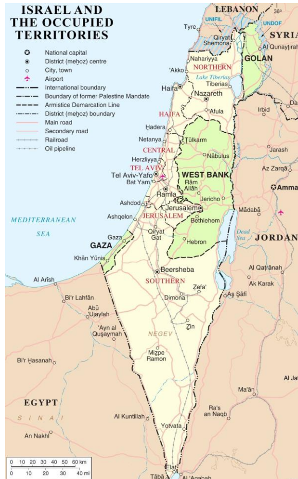
Figur 6: Staten Israel og dens okkuperte områder fra Seksdagerskrigen (minus Sinai). 20

mener de tilhører dem, mens palestinerne mener de skal være i deres besittelse og kontroll. Det betyr med andre ord at man på nesten femti år i realiteten er like langt som det man var ved krigens slutt i 1967 (minus Sinai), og det ser ikke ut som det er noen løsning i sikte i løpet av nærmeste fremtid.