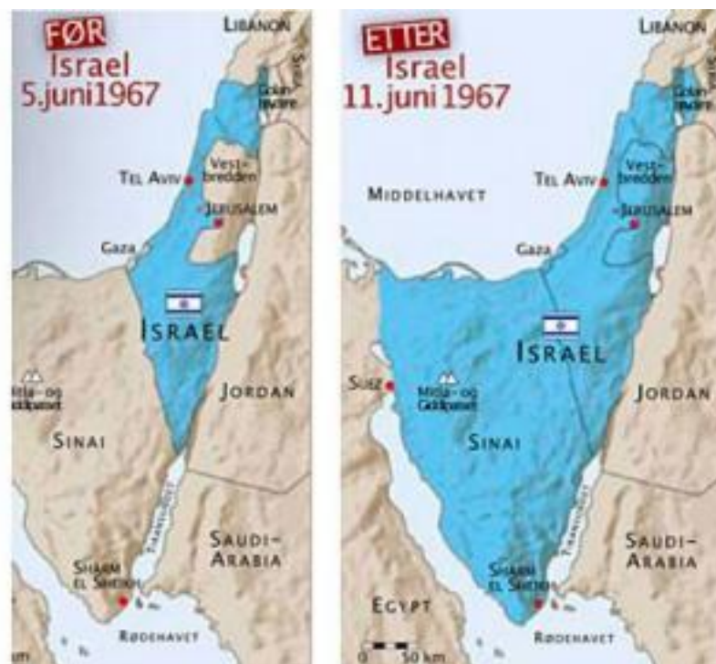
Figur 1: Kart over Israel før og etter Seksdagerskrigen. 2

Den 5. juni startet Israel et lynangrep mot flyvåpenet til de arabiske landene Egypt, Jordan og Syria. Det israelske flyvåpenet tilintetgjorde 304 egyptiske, 53 syriske og 28 jordanske militærfly hvorav flertallet stod på bakken. 1 I dagene som fulgte erobret israelske soldater Sinaihalvøya og Gazastripen fra Egypt, Vestbredden og Øst-Jerusalem fra Jordan og Golanhøydene fra Syria. 10. juni godtok de arabiske lederne våpenhvile.