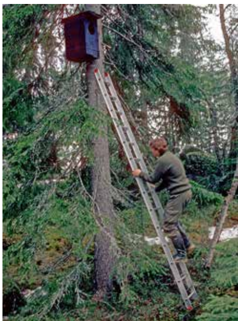
Bruk stige når du skal henge opp en uglekasse, og når du skal se hva som er i den. Roar Solheim ©