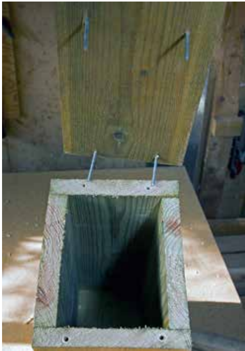
Når taket festes med spiker som passer ned i hull i veggene, kan det lett åpnes slik at du kan se ned i kassa.