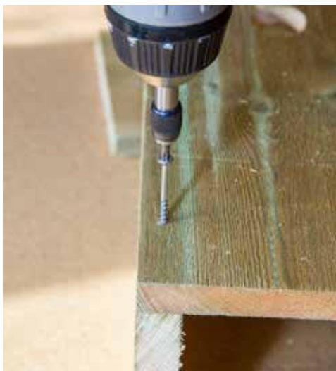
Det er mye enklere å skru sammen uglekassene med terrasseskruer enn å spikre dem sammen.

Det er ikke til å komme forbi at spenningen og forventningen ligger noen hakk høyere når du henger opp en stor fuglekasse enn når du undersøker de mindre meisekassene. I Agder har du gode sjanser til å få kattugle som kassehekker. Lenger inn i landet er perleugla en av de vanligste gjestene i store fuglekasser. Plutselig knurrer det nede i kassa, og så er det ei stor laksand som har lagt seg til å ruge. Eller kanskje er det kvinanda som har lagt sine blågrønne egg i et reir av myke dun.