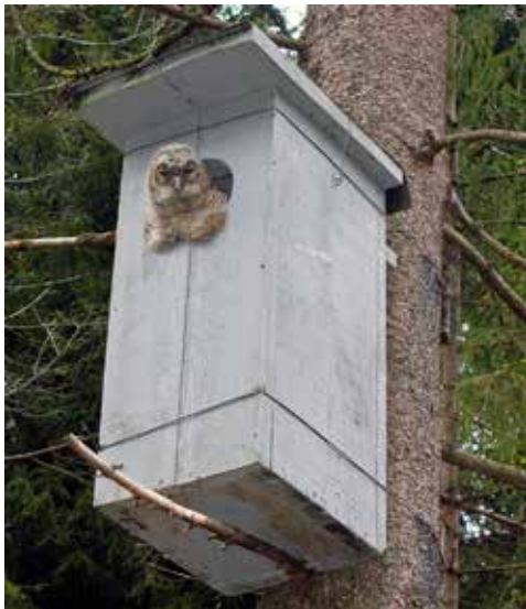
Det er spennende når kattuglene har tatt i bruk en fuglekasse! Her er en av ungene så stor at den er på vei til å forlate fuglekassa. Roar Solheim ©